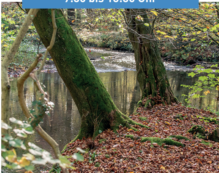
Straußenfarm und Eifgenbachtal

Freitag, 26. Juli 2024, 9:30 bis 13:30 Uhr